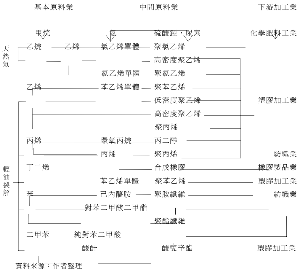
圖 1 主要石油化學產品流程圖

發展組織下的定義：「由基本原料至最終產品之階段，屬於石油化學工業之範疇。」（《石化工業》4，1，1982：22）。因此，石化業的範圍極廣，如化肥（主要是氮肥，以液氨為主要原料，而液氨以天然氣為原料）亦屬於石化工業的範疇。然卻因為石化工業這「產品眾多、製造方法複雜」的產業結構（如附錄圖 1），其範圍的界定可謂眾說紛紜；惟為了研究之便，筆者依石化工業業類特性、生產條件 4 與產品性質而界定與區分其範圍（如圖 1）：