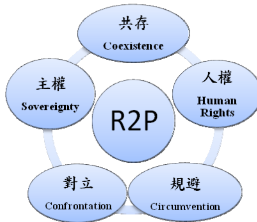
圖二 主權與人權的競合關係圖：「對立」、「共存」或「規避」

本節試圖以「對立」（confrontation）、「共存」（coexistence）或「規避」（circumvention）三面向的整合來處理主權與人權的競合關係，探究《國家保護責任》的提出是否使主權與人權關係出現變化，三者關係詳見（圖二）。